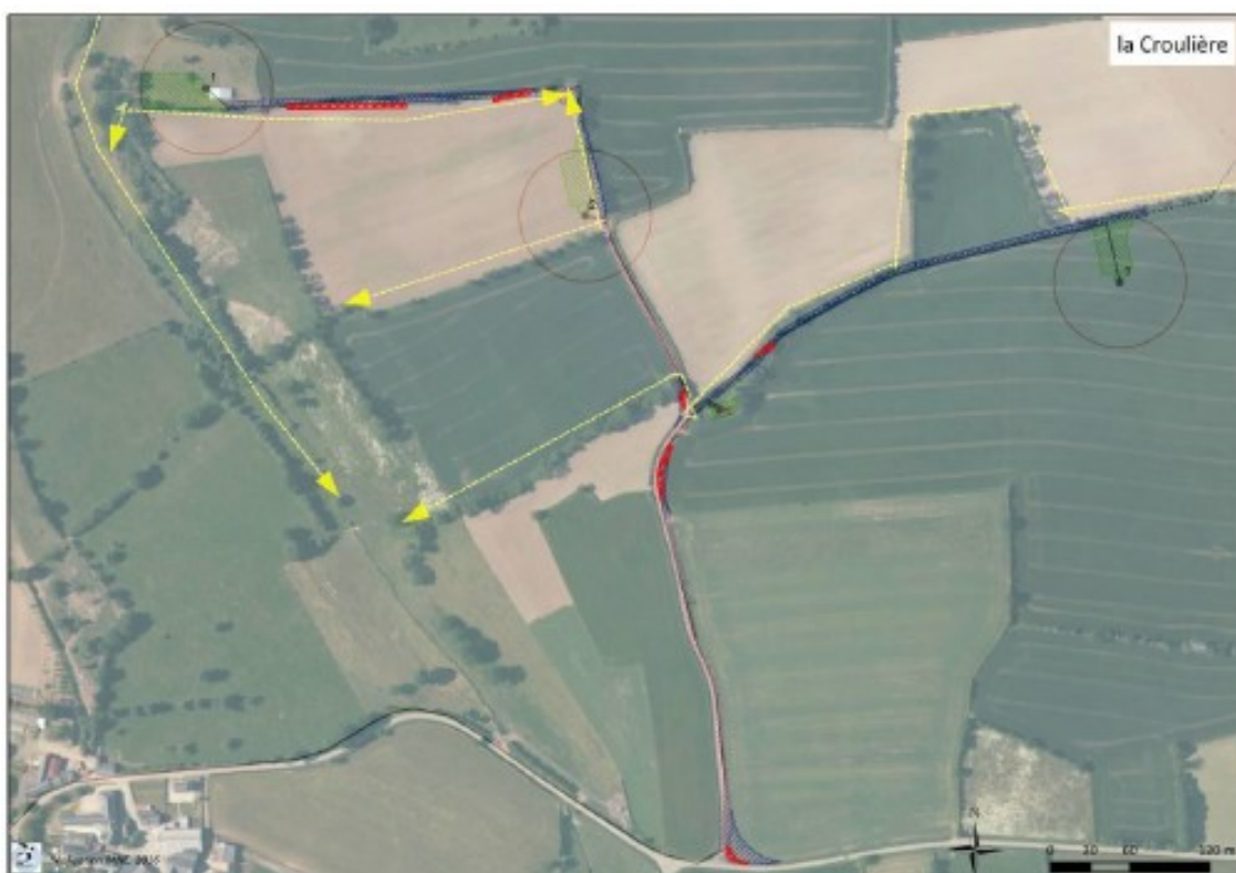
Figure 102 : Axes de déplacements des chiroptères et les zones de survol des pales

Le dossier rappelle que deux des éoliennes se situent à moins de 50 mètres, et la troisième à moins de 100 mètres des haies et souligne de ce fait que "les risques de collision sont donc élevés pour l'ensemble des 3 éoliennes du parc" . Ce risque est accentué, comme l'illustre la cartographie ci-dessous, par le fait que des axes identifiés de déplacements des chiroptères se situent au niveau des haies survolées par les pales des éoliennes.